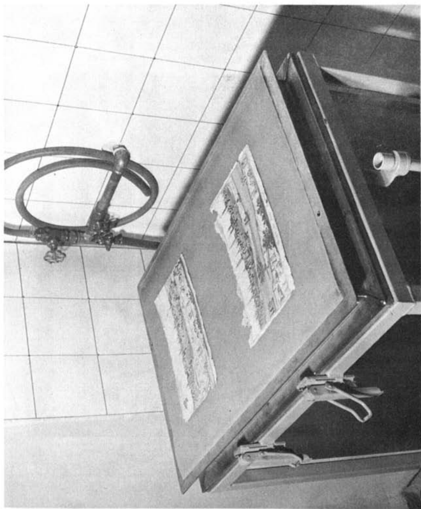
Beschädigte Blätter auf dem Gitter